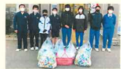
小美玉市立玉里中学校