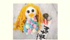
小美玉市更生保護女性会